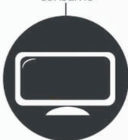
Aparatos electrónicos de consumo