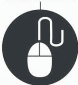
Equipos de informática y telecomunicaciones