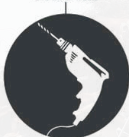
Herramientas eléctricas y electrónicas